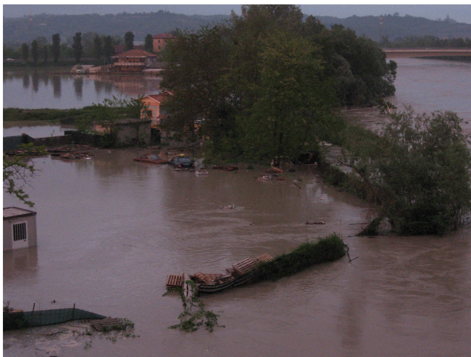
Foto 4: piena del 27-28.04.09, vista dal viadotto della tangenziale: particolare dell'attività in sponda sinistra del Rio Loreto, nei pressi della nuova chiavica