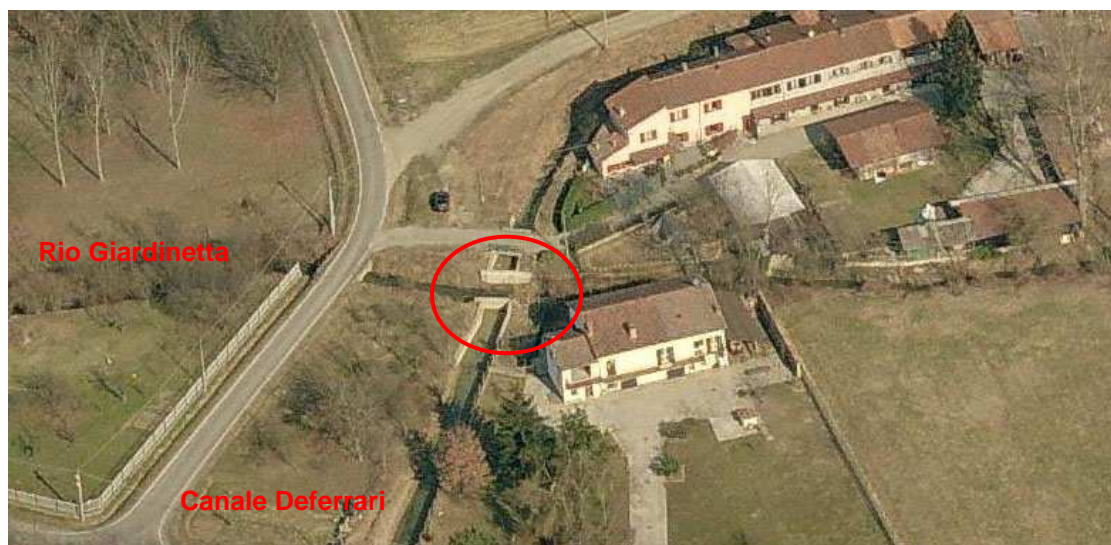
Foto 9: intersezione del Rio Giardinetta con il Canale Deferrari