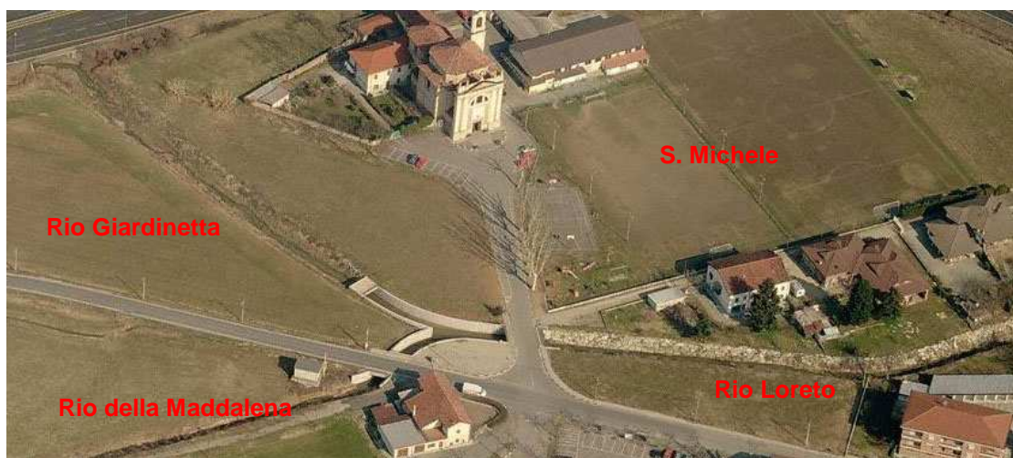
Foto 8: confluenza dei Rii della Maddalena e Giardinetta nel Rio Loreto

Il bacino idrografico del Rio Loreto (vedi tavola LOR 3001) fa capo sostanzialmente a due importanti cavi: il Rio della Maddalena ed il Rio Giardinetta, con relativi fossi ad essi afferenti, che confluiscono nel Rio Loreto nei pressi della chiesa di San Michele, mediante manufatto idraulico di recente costruzione (vedi Foto 8).