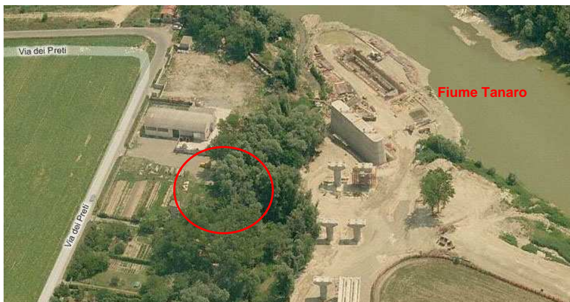
Foto 7: localizzazione indicativa dell'intervento

Come si evince dalle foto, tale area è stata di recente oggetto dei lavori di realizzazione del nuovo viadotto della tangenziale nord di Alessandria sul Fiume Tanaro