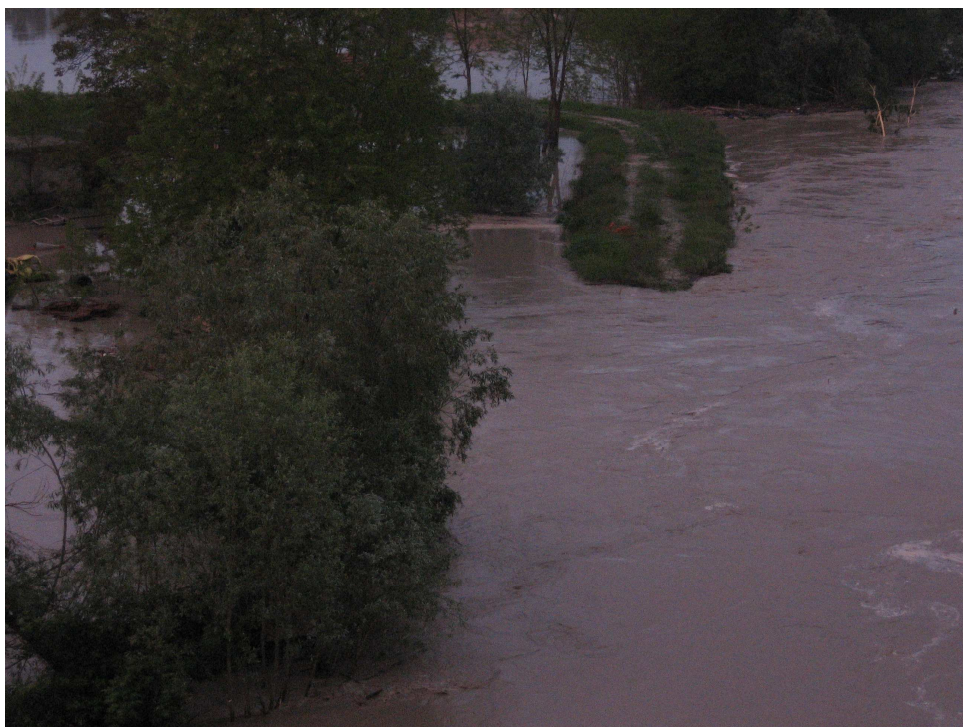
Foto 3: piena del 27-28.04.09, vista dal viadotto della tangenziale: particolare della foto precedente