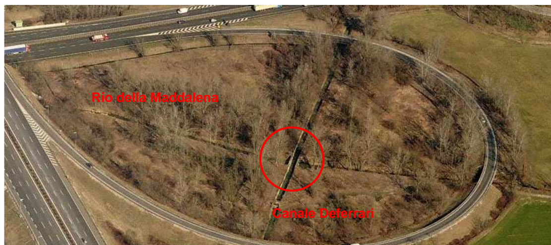
Foto 10: intersezione del Rio della Maddalena con il Canale Deferrari

Tali intersezioni rappresentano possibili punti strategici in cui valutare la possibilità di scolmare 1 , in caso di piena, almeno parte delle portate di entrambi i Rii sopra citati, riducendo pertanto l'entità della portata defluente a valle e da sollevare in corrispondenza della chiavica (in caso di piena del Tanaro a paratoie chiuse).