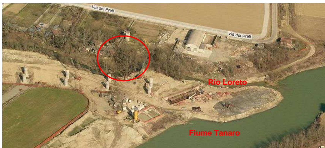
Foto 6: posizione approssimativa dell'intervento

La chiavica oggetto di intervento sarà localizzata nel tratto terminale del Rio Loreto, circa 50 metri a monte dello sbocco del corso d'acqua nel Fiume Tanaro, come mostrato nella Foto 6 e Foto 7, riprese aeree tratte da Bing™ Maps.