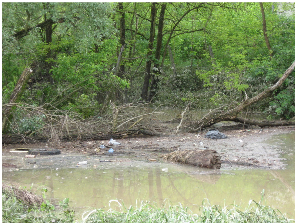
Foto 5: piena del 27-28.04.09, materiale flottante di varia natura trasportato dal Rio Loreto

Come evidenziano le Foto 2 e seguenti (per gentile concessione della ditta Brandolese & C. S.n.c) l'esondazione è avvenuta principalmente per le seguenti cause: