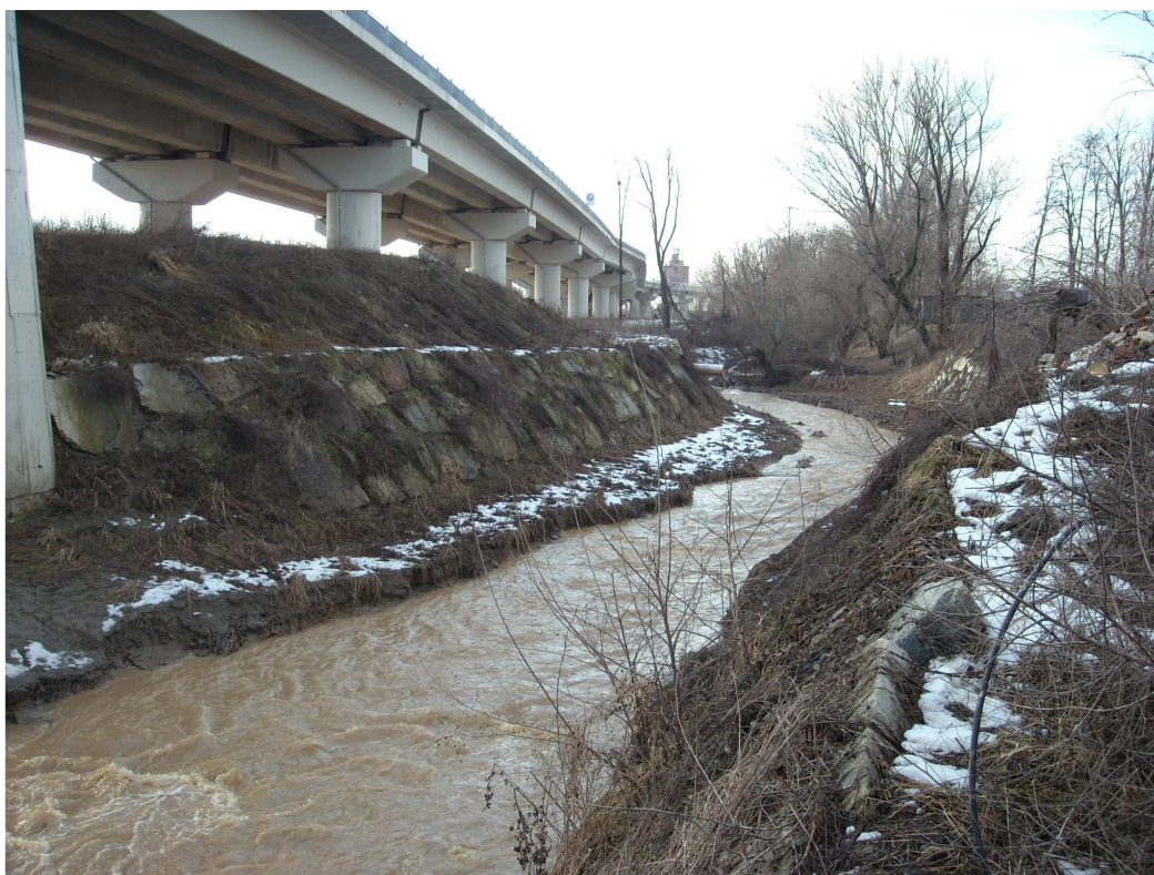
Foto 1: confluenza del Rio Loreto nel Fiume Tanaro, sulla sinistra la spalla sinistra del nuovo viadotto della tangenziale nord di Alessandria

Più in particolare, le opere si collocano in corrispondenza dello sbocco di tale corso d'acqua nel Fiume Tanaro, nei pressi del viadotto di attraversamento della tangenziale nord di Alessandria (S.R. 10), di recente realizzato (vedi Foto 1).