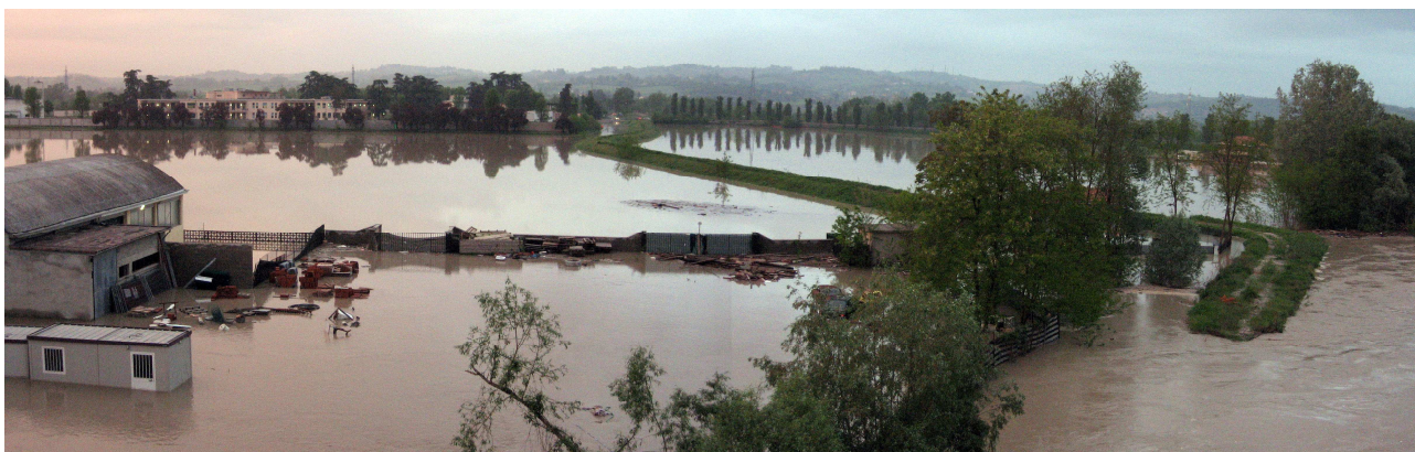
Foto 2: piena del 27-28.04.09, vista dal viadotto della tangenziale: si noti l'apertura in corrispondenza dell'inizio dell'arginatura di sinistra Tanaro immediatamente a valle della confluenza con il Loreto

Attualmente infatti le acque defluenti nel Rio Loreto possono scaricarsi in Tanaro soltanto al di sotto di una certa altezza idrica di quest'ultimo, superata la quale il Loreto stesso comincia ad avere un funzionamento rigurgitato da valle. Al progredire dei livelli di piena del Tanaro è quest'ultimo che risale lungo il Loreto e, in assenza di argini raccordati ed a quota di difesa pari a quella del Tanaro, avviene l'esondazione del territorio.